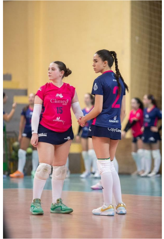
Sub-17 Feminino – XXXII Copa Regional de Voleibol (09/2024)