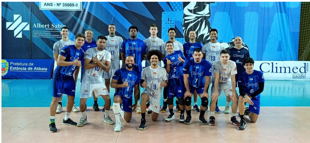
Equipe masculina adulta no Campeonato Paulista 2024 Divisão Especial (08/2024)