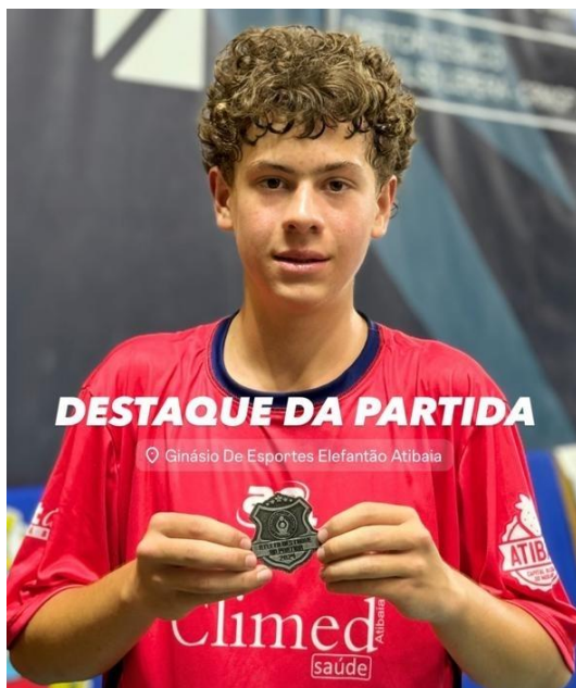
XXXII Copa Regional de Voleibol (08/2024)