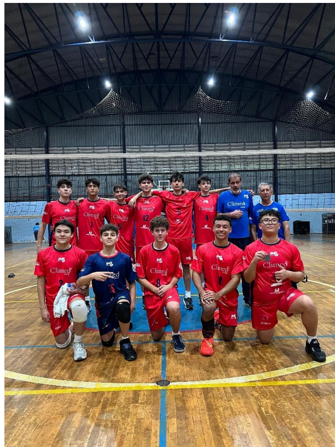
Sub-17 Masculino na XXXII Copa Regional de Voleibol (06/2024)