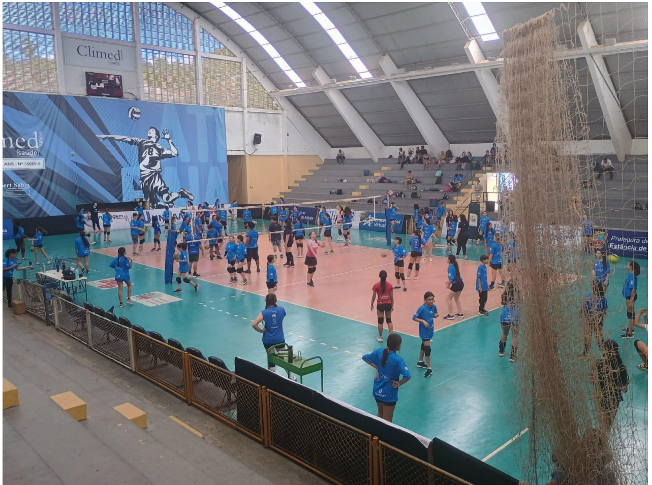
Social (Iniciação), Ginásio Elefantão (10/2024)