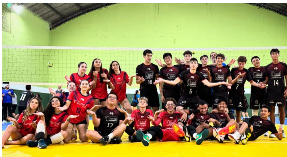
Equipes Sub-17 Masculina e Feminina – XXXII Copa Regional de Voleibol (02/2024)