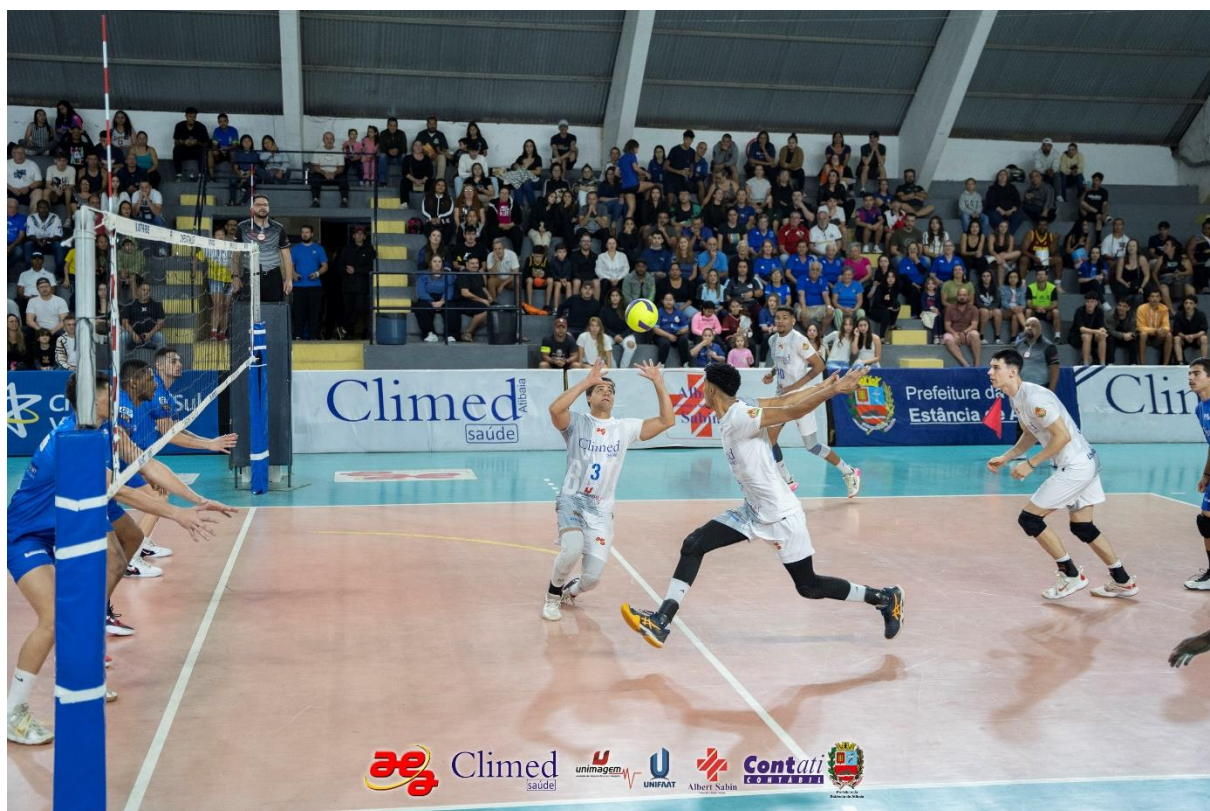
Campeonato Paulista Divisão Especial – Climed/Atibaia x Santo André (09/2024)