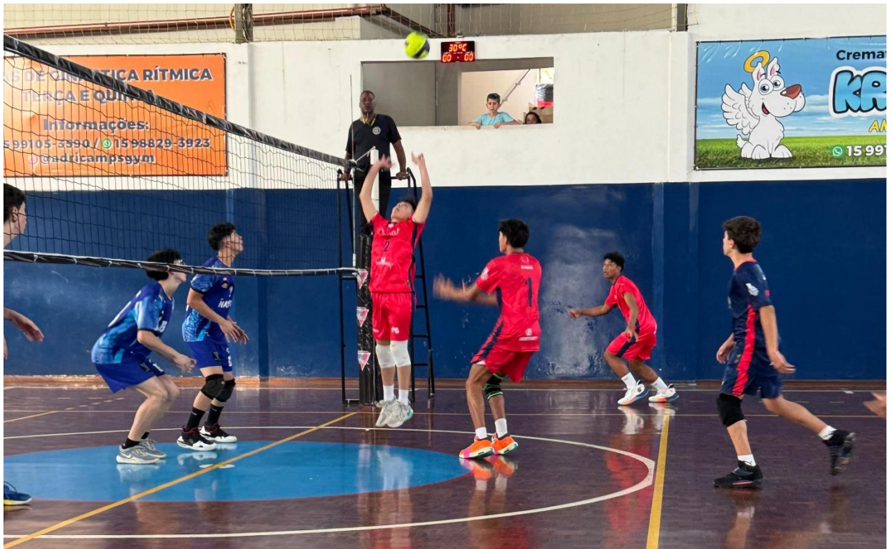
Sub-17 Masculino – XXXII Copa Regional de Voleibol (09/2024)