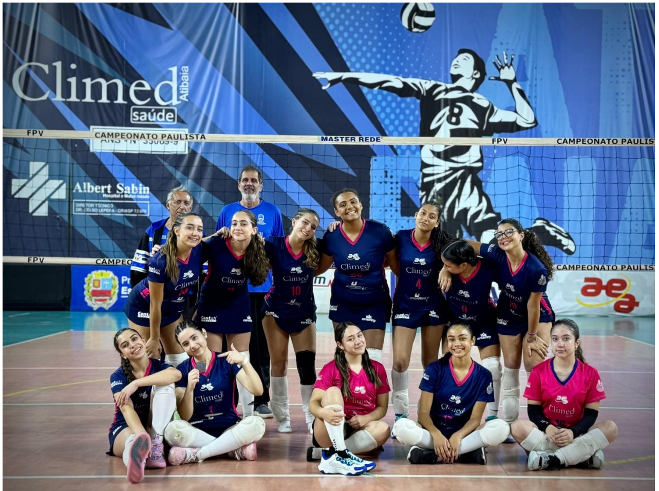
Equipe Sub-17 Feminina, vice campeã da XXXII Copa Regional de Voleibol (12/2024)