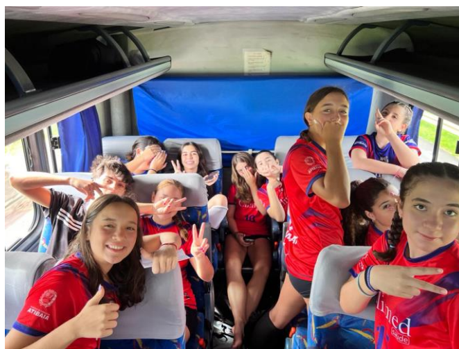
Equipe Sub-17 Feminina em viagem para jogo da XXXII Copa Regional de Voleibol (03/2024)