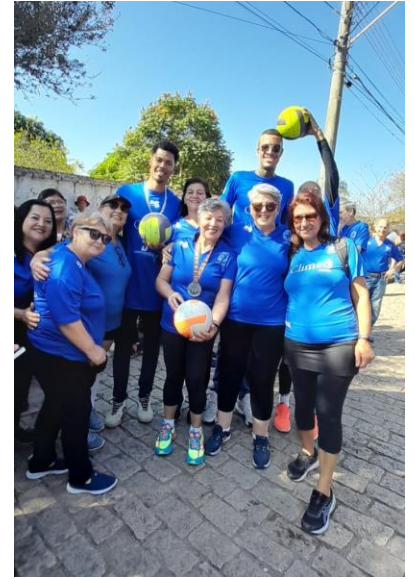
Desfile cívico em comemoração pelo 359º aniversário de Atibaia (24/06/2024)