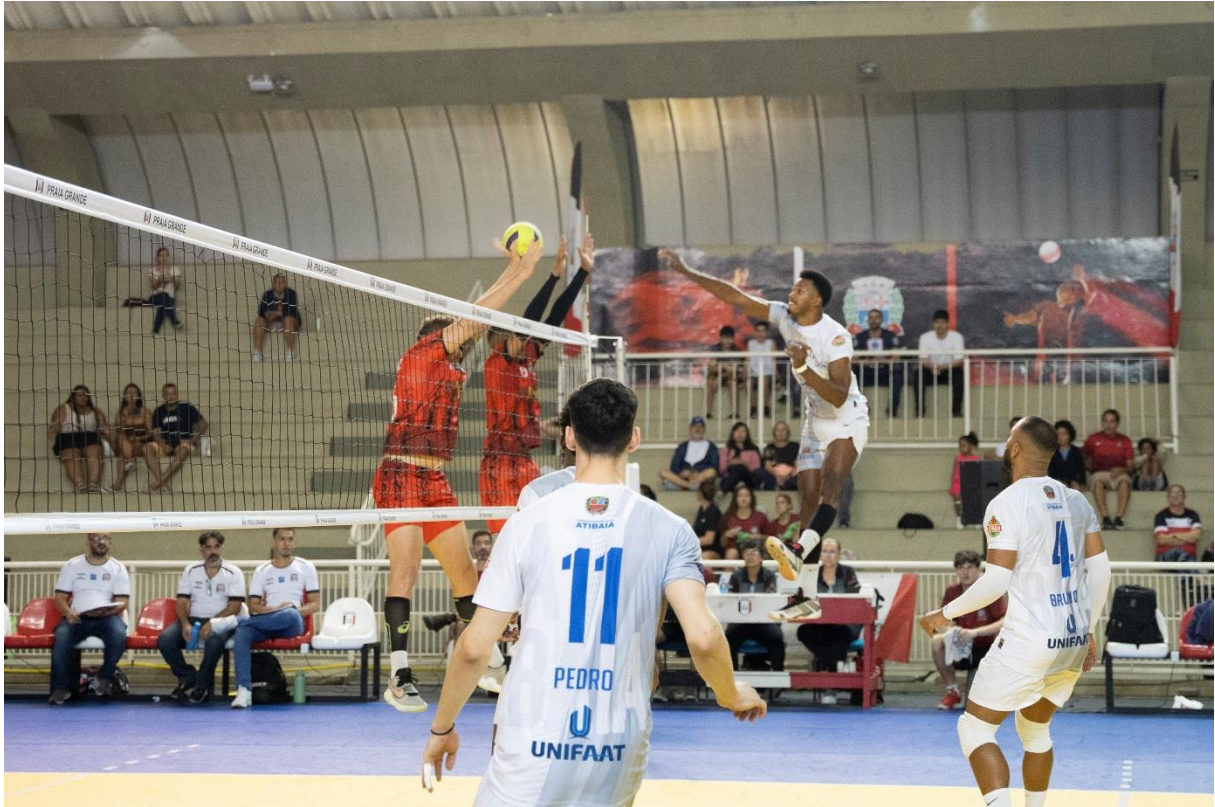
Campeonato Paulista Divisão Especial – Climed/Atibaia x Praia Grande (09/2024)