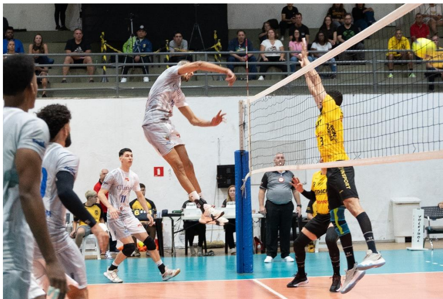
Campeonato Paulista Divisão Especial – Climed/Atibaia x Guarulhos (08/2024)