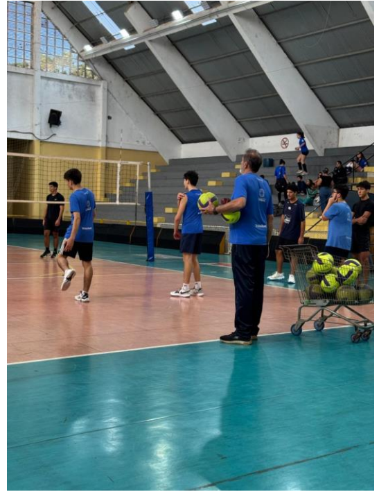
Treinamento técnico e tático do equipe Sub-17 Masculino no Ginásio Elefantão (06/2024)