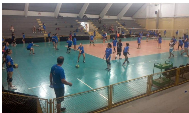
Social (Iniciação) no Ginásio Elefantão 03/2024)