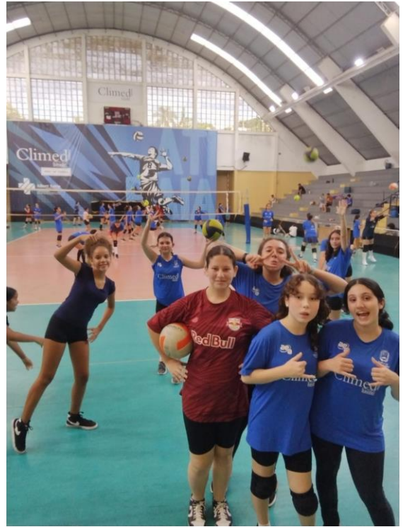
Social (Iniciação) no Ginásio Elefantão (05/2024)