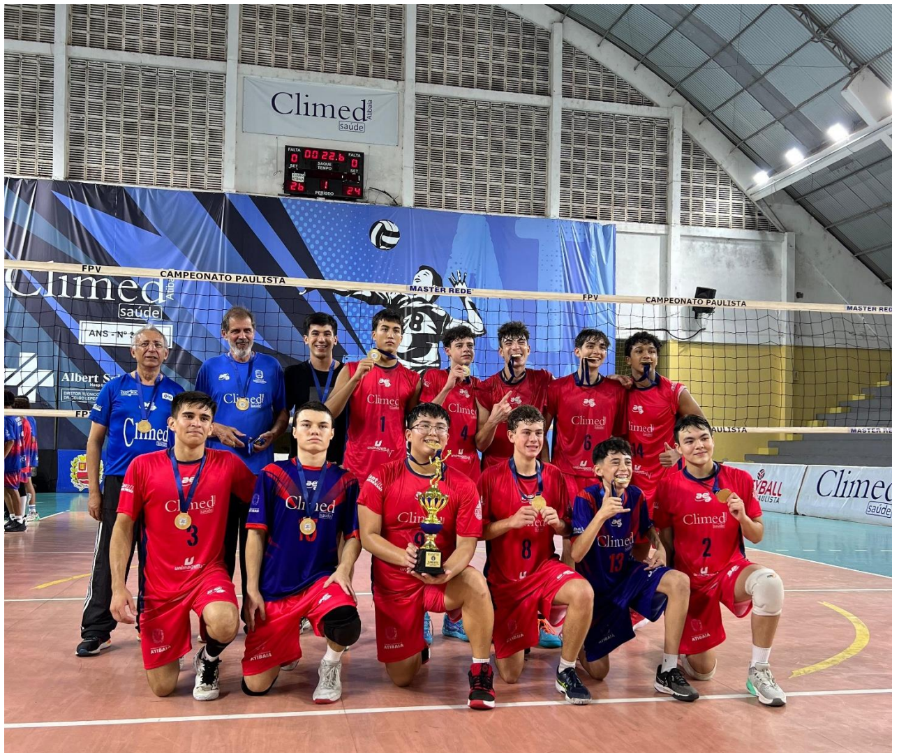
Equipe Sub-17 Masculina, campeã da XXXII Copa Regional de Voleibol (12/2024)