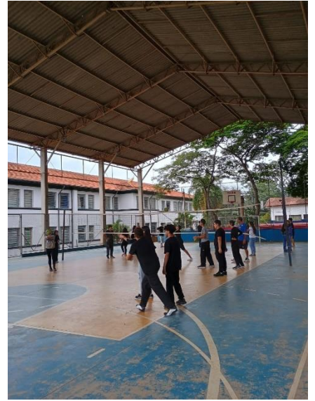
Social (Iniciação) no contraturno da EE Major Juvenal Alvim (08/2024)