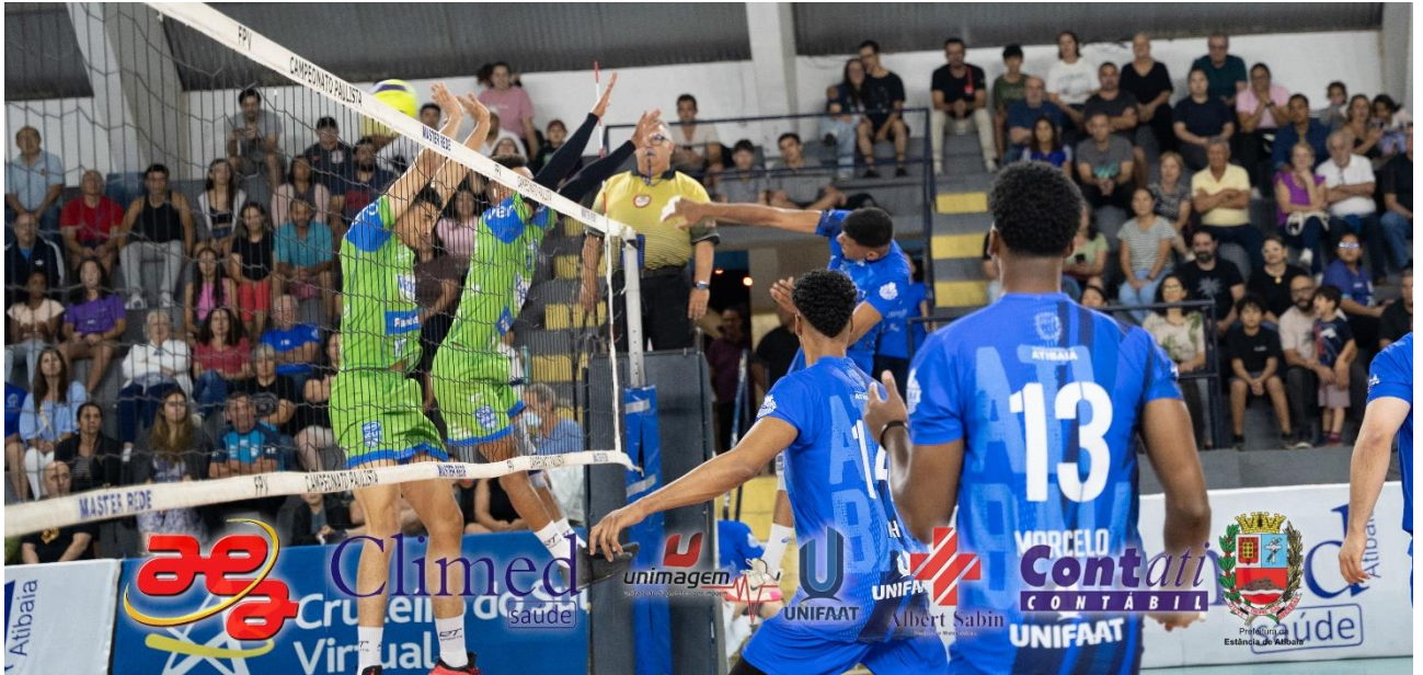
Campeonato Paulista Divisão Especial – Climed/Atibaia x São José dos Campos (09/2024)