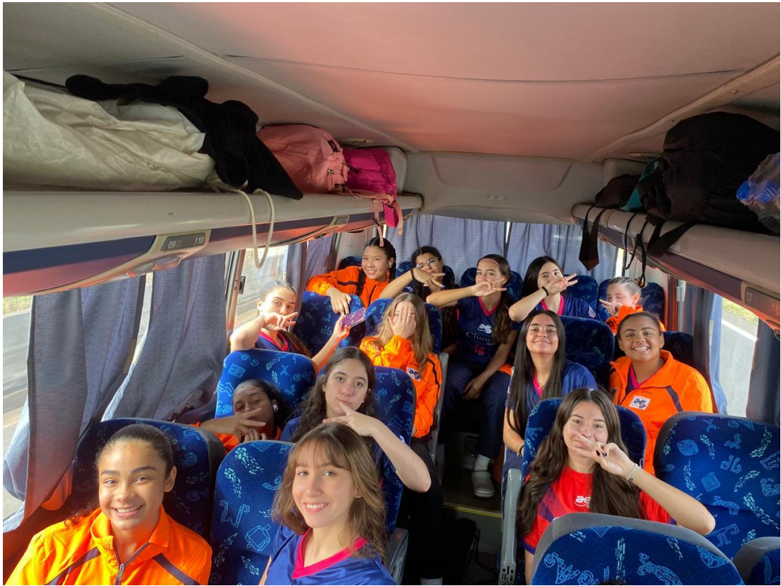
Sub-17 Feminino na XXXII Copa Regional de Voleibol (07/2024)