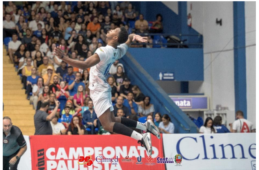
Campeonato Paulista Divisão Especial – Climed/Atibaia x Campinas (09/2024)