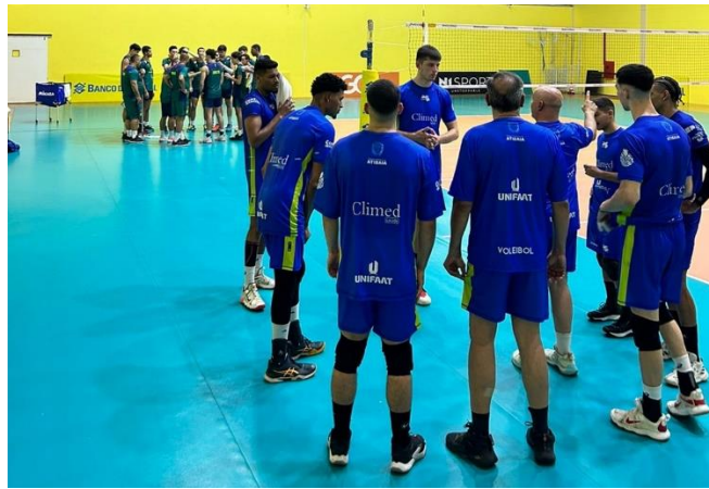
Equipe masculina adulta (alto rendimento) Jogos amistosos contra a Seleção Brasileira Sub-21 em Saquarema/RJ, sede da CBV (08/2024)