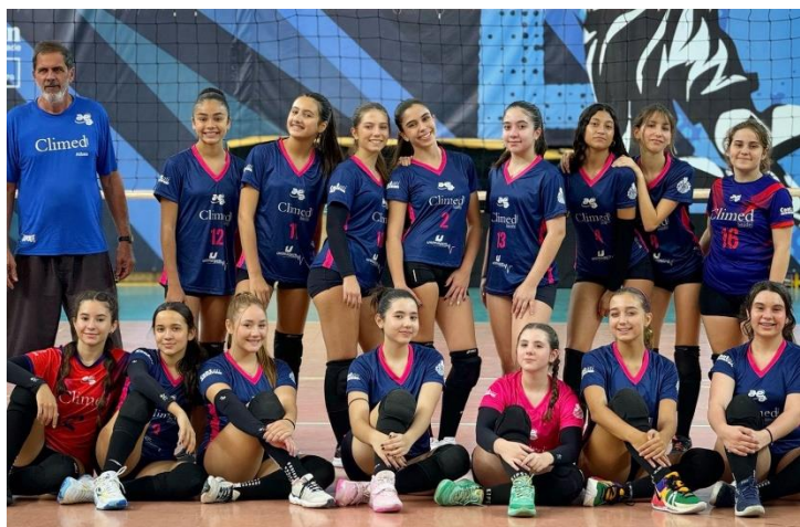
Equipes Sub-17 Masculina e Feminina – XXXII Copa Regional de Voleibol (05/2024)