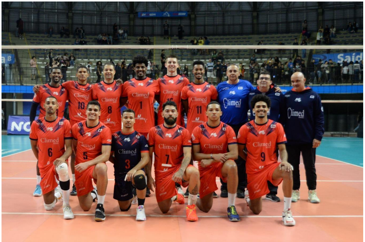
Vôlei adulto masculino de alto rendimento na disputa do Campeonato Paulista Divisão Especial (AGO/2023)