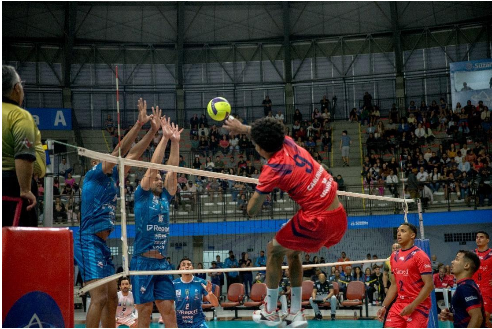
Campeonato Paulista Divisão Especial, jogos contra Suzano e Santo André (AGO e SET/2023)