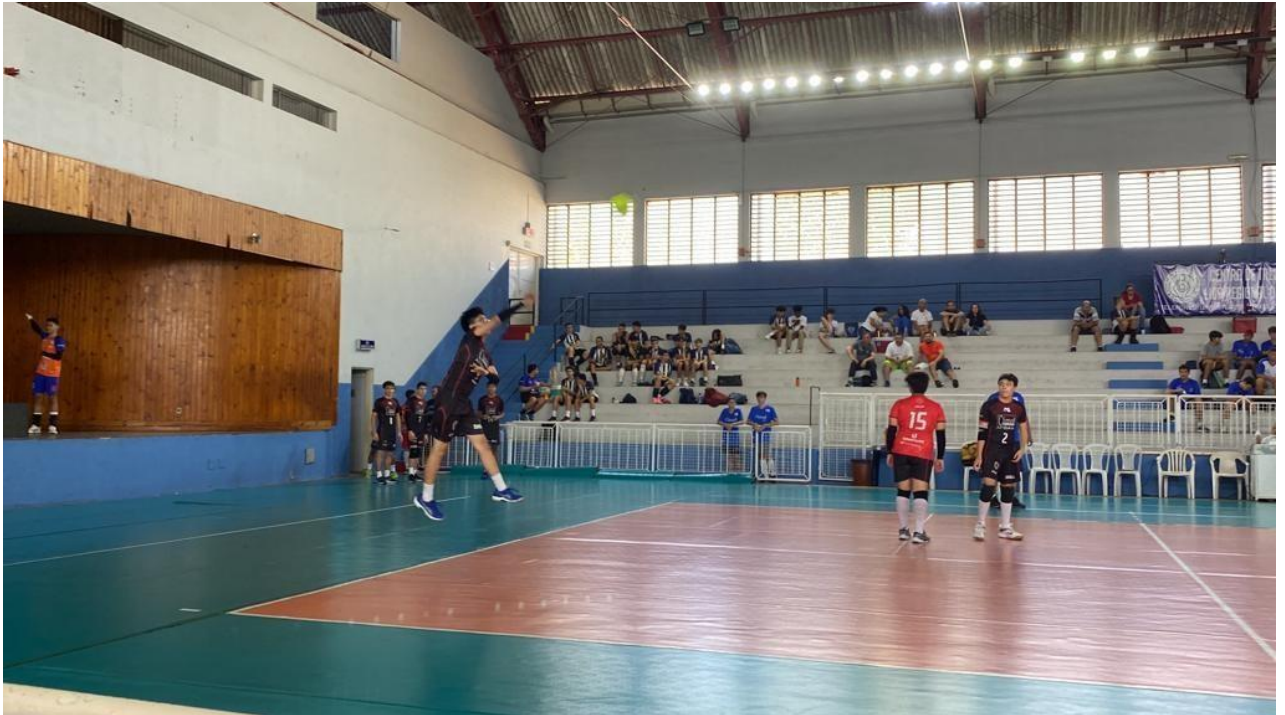
Categoria de base Sub-17 masculino na disputa da Liga Regional de Voleibol (ABR/2023)