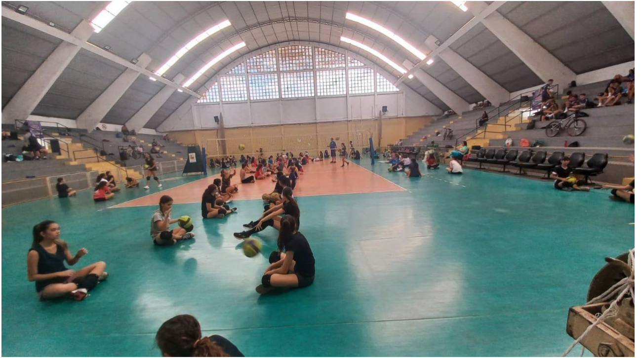
Desenvolvimento motor, técnico e aprimoramentos dos gestos técnicos inerentes a modalidade (MAI/2023)