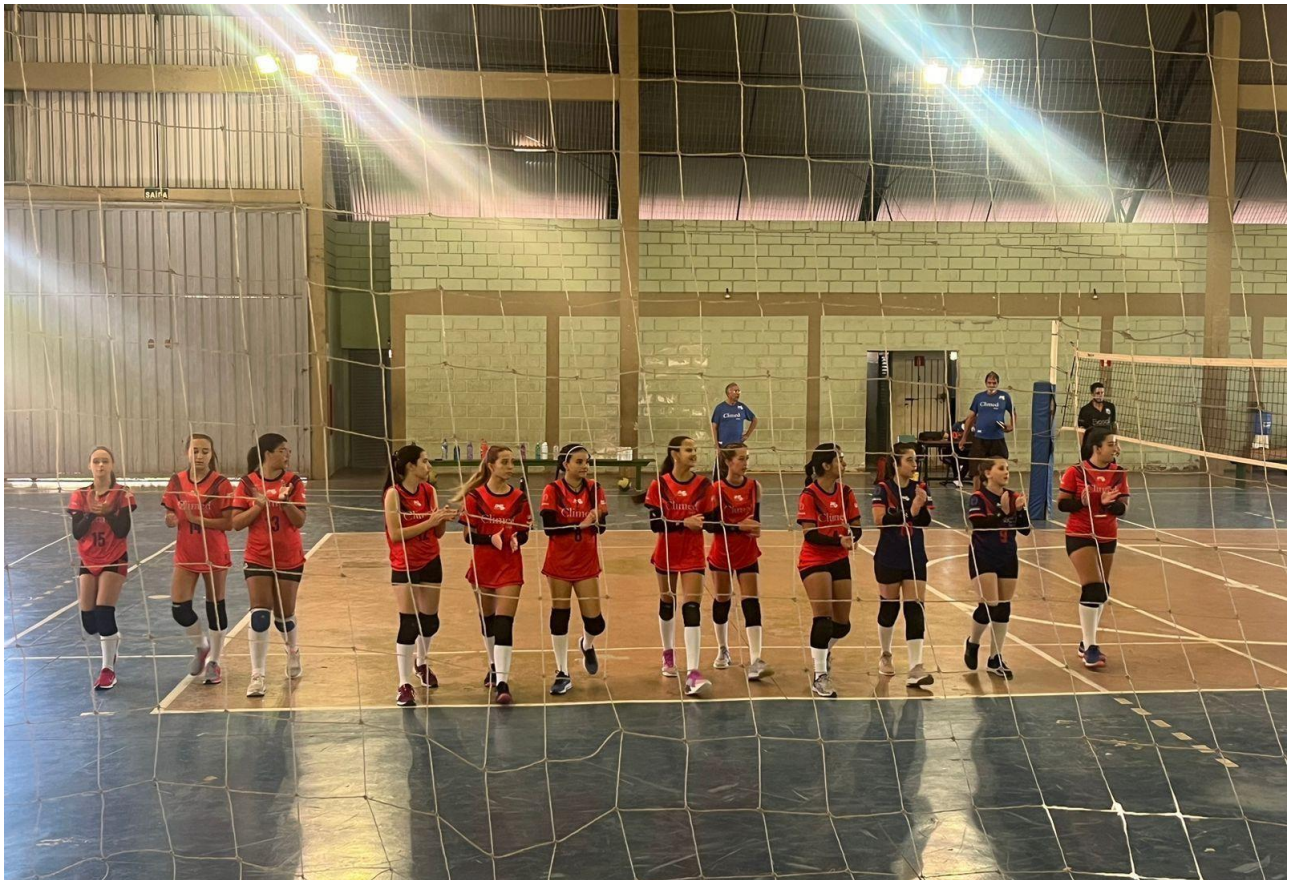
Categoria de base Sub-15 feminino e Sub-17 masculino na disputa da Liga regional de Voleibol (MAI/2023)