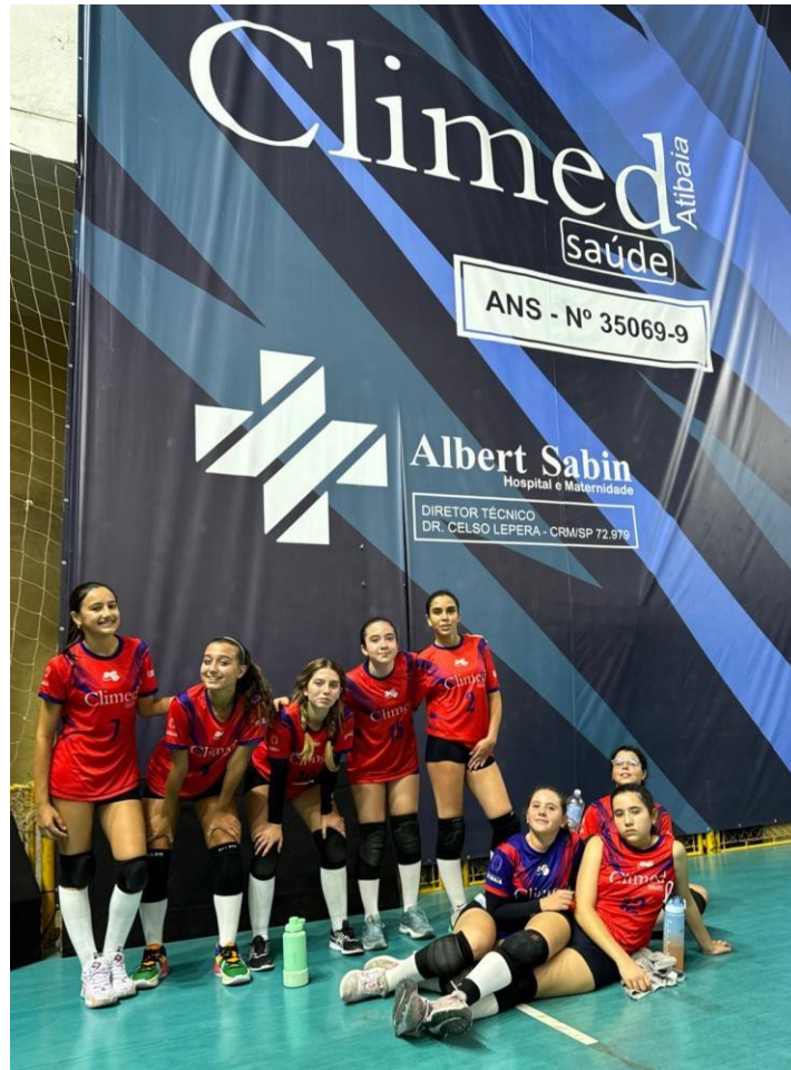
Treinamento Sub-15 feminino, visando desenvolvimento das capacidades físicas, técnicas e táticas (AGO/2023)