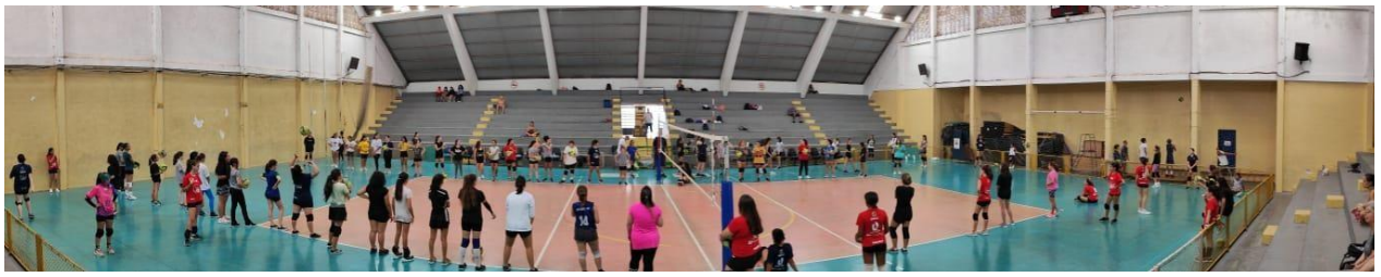
Vôlei Social, cerca de 100 meninos e meninas, participando dos treinamentos, visando o desenvolvimento individual e da modalidade (ABR/2023)