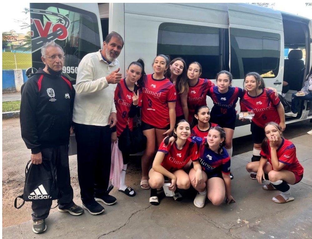
Sub-15 feminino na Liga Regional de Voleibol (MAI/2023)