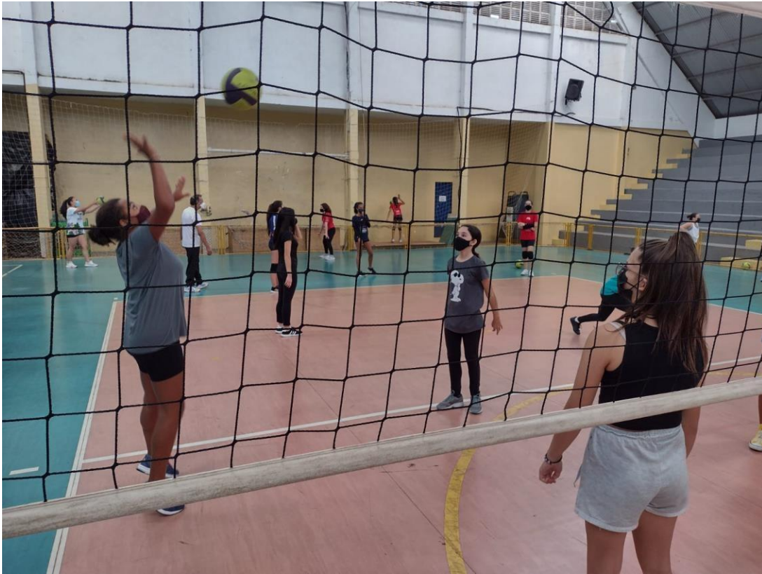
Vôlei social feminino, cerca de 120 participantes praticando a modalidade semanalmente, aproveitando o tempo ocioso em busca de novos talentos (MAR/2022)