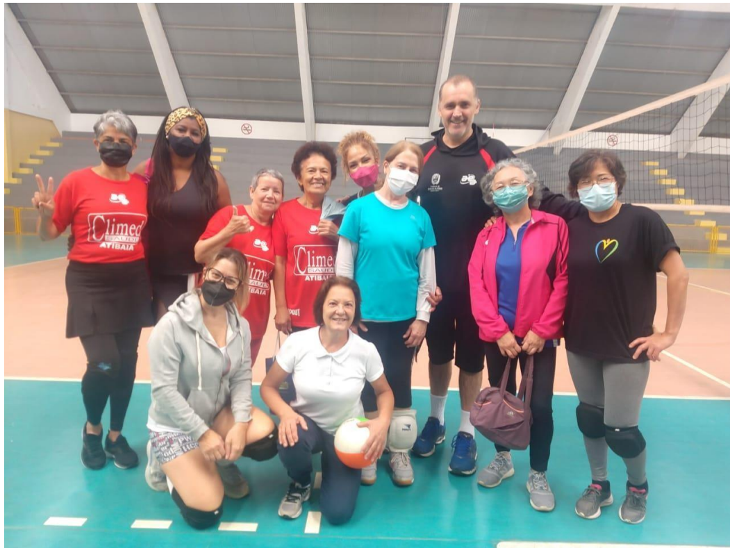
Vôlei Melhor Idade, visando melhor qualidade de vida aos nossos idosos (MAI/2022)