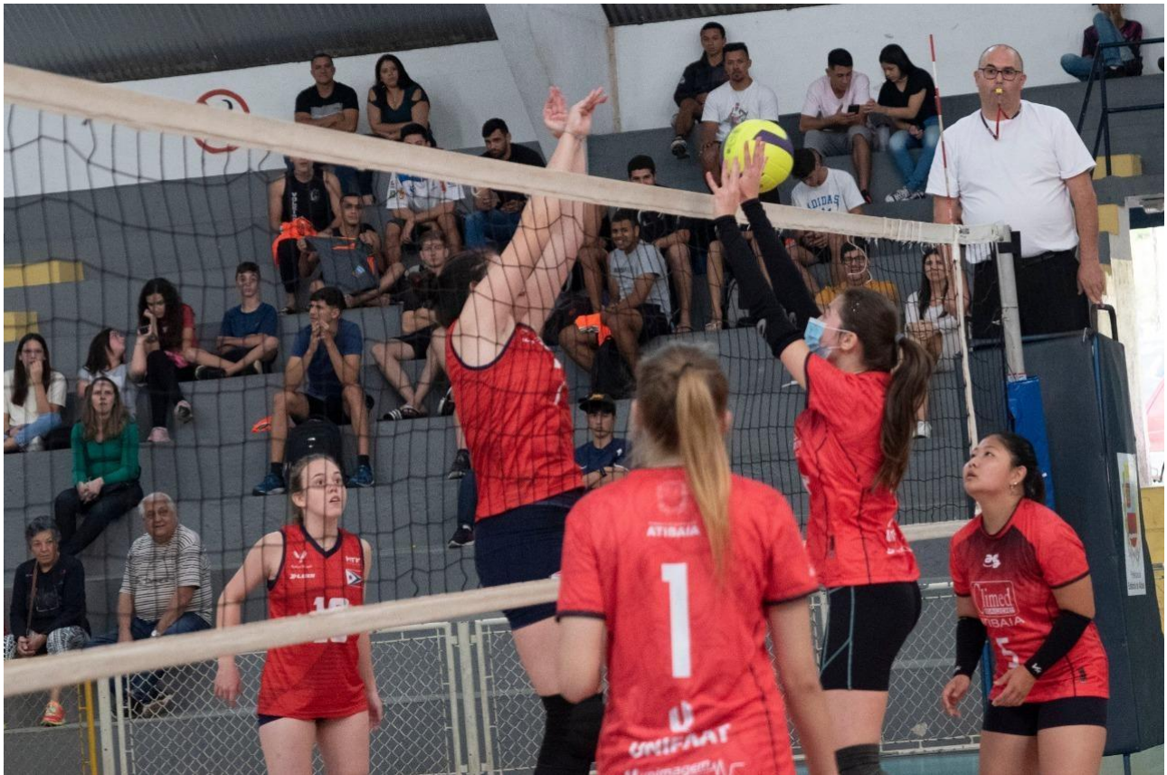
Categorias de base Sub-17 feminino e Sub-19 masculino na disputa da Liga Regional de Voleibol, liga parceira da Federação Paulista de Voleibol (SET/2022)