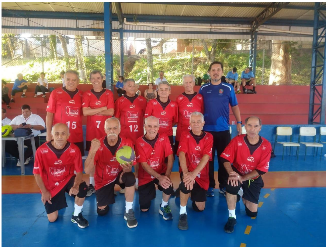
Vôlei Melhor Idade, visando melhor qualidade de vida aos nossos idosos (JUL/2022)