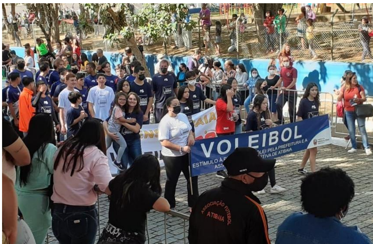
Interação entre a modalidade e a população, visando entretenimento, desenvolvimento social e formação de cidadãos do bem (JUN/2022)