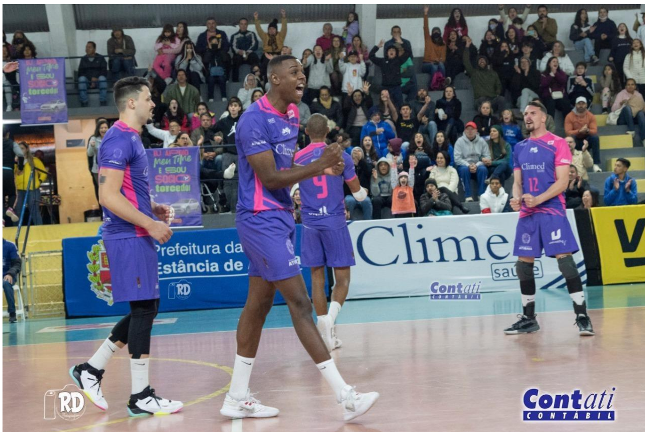
Equipe Adulta de Alto Rendimento na disputa do Campeonato Paulista Divisão Especial (AGO/2022)