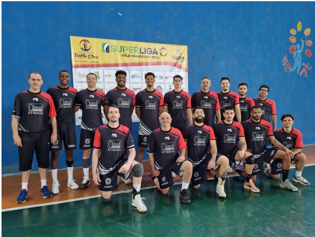
Equipe Adulta de Alto Rendimento, 2º lugar na Superliga C 2022 (NOV/2022)