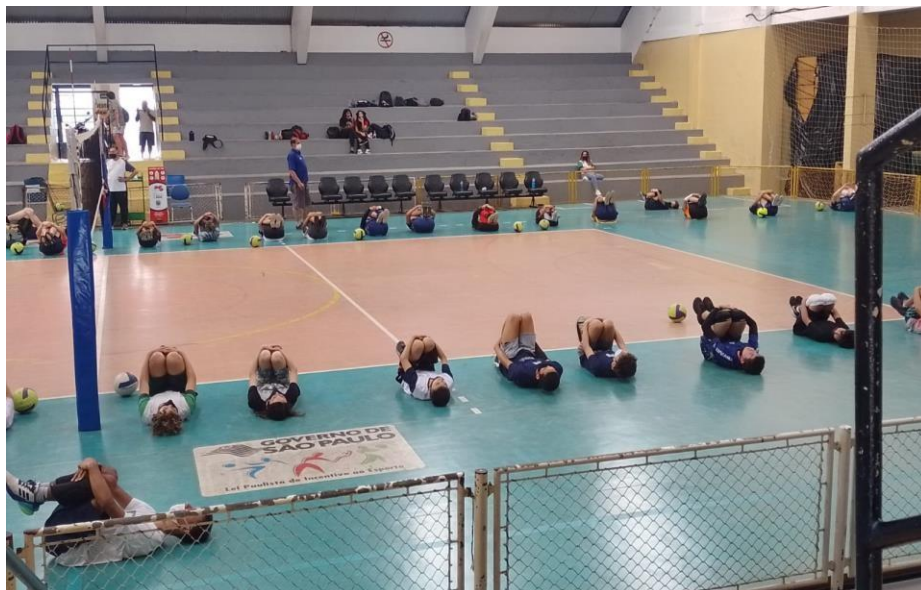
Vôlei Social misto, meninos e meninas desenvolvendo o voleibol em busca de novos atletas para representar Atibaia no cenário estadual e nacional da modalidade (ABR/2022)